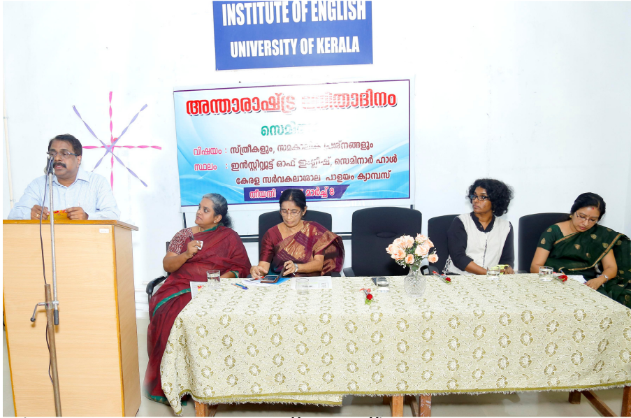
(ഫോട്ടോ ഇ-മെയിൽ ചെയ്തിട്ടുണ്ട്)